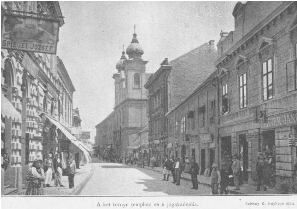
1. kép – A Pécsi Püspöki Joglyceum épülete 5

Témánk szempontjából szükséges röviden áttekintenünk a jogászképzés történetét, hiszen, ahhoz hogy a jogi képzésben használatos szakkönyvek, tankönyvek (és azon belül is a történelemtankönyvek) használatával kapcsolatos megállapításokat tegyünk, be kell ágyoznunk a témát a jogakadémiák, a joglíceumok oktatási rendjének rövid történetébe.